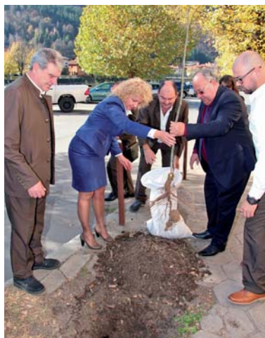
Залесяване пред административната сграда на стопанството