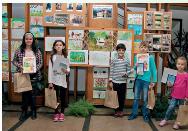
Наградените ученици в конкурса за рисунка от НУ „Хаджи Генчо“ - Тетевен

та към служителите на стопанството беше да запазят зеленото богатство за поколенията. И сме уверени, че красотата на Тетевенския балкан, дарена му от труда на лесо-въдите и горските работници на Държавното горско стопанство, винаги ще буди гордост.