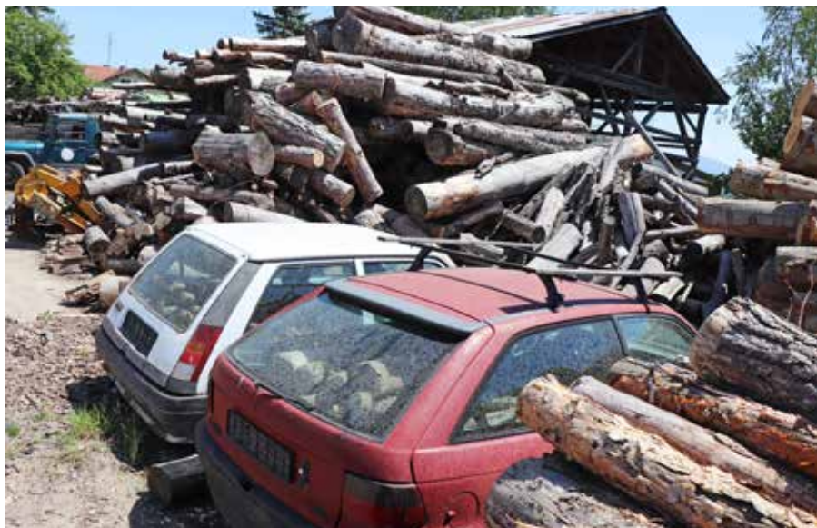
Склад за задържани дървесина и вещи – предмет на нарушения, на ДЛС „Алабак“ в кв. Каменица