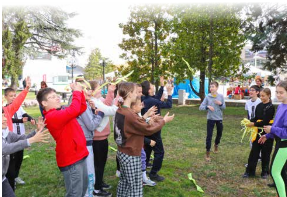
Деца на Пловдив с радост се включиха в образователни игри, проведени от горските педагози на тазгодишното изложение „Природа, лов и риболов“

сем беседи в часовете на учениците. Имаме идея да превърнем в открита класна стая нашия дендрариум. Той е създаден през 2007 г. в двора на Дирекцията и от тогава всяка година се обогатява с нови дървесни видове. Сега могат да се видят около 20 широколистни и 10 иглолистни вида, което ще е много познавателно за децата.