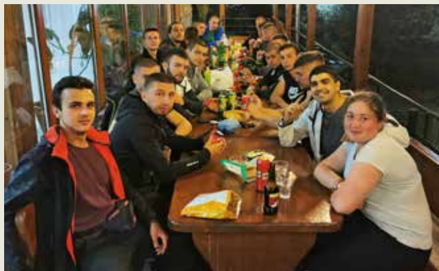
УОГС „Петрохан“ – започваме практиката

Маршрутът, по-който щяхме на минем, беше: София – Беледи