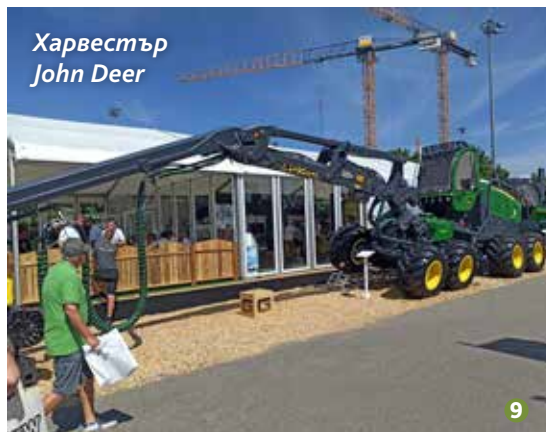
9 Харвестър John Deere