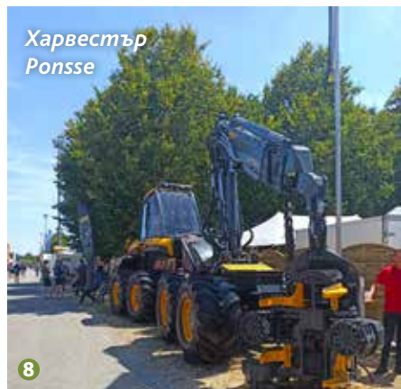
8 Харвестър Ponsse

Трети докладчик от наша страна беше Божидар Петков – един от собствениците на фирмата за доставка на горска техника „Прогрес техник“ ООД, която успешно