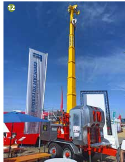
Планински харвестър Syncrofalke 45