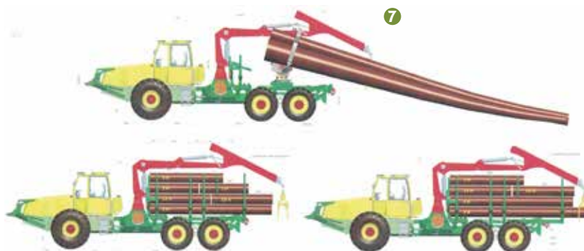
7 Екипировка на универсалния форвардер LKT 210

ни, или т.нар. планински харвестъри, които са съчетание на въжена линия за извоз от сечището и кран-процесор за обработка – кастрене и разкрояване на дървесината на камионен път. Комбинираната машина на Konrad Forsttechnik – Mounty 4000, също е позната у нас – с нея работят 12 български дърводобивни фирми. С машината може да се извозват материали от дълбочина в сечището до 550 м при извоз само нагоре и товароподемност до 3 тона (сн. 10).