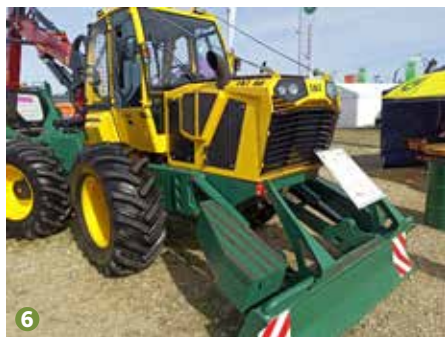
6 Специализиран горски трактор LKT 60

На интереса на посетителите се радваха комбинираните маши-