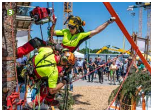
Състезание по кастрене между професионални секачи