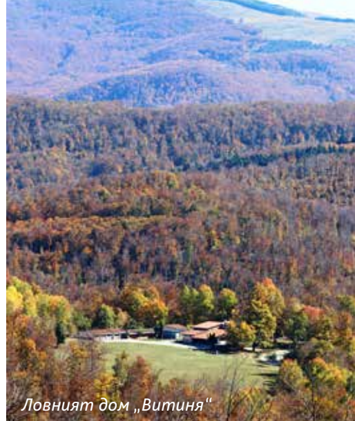
Ловният дом „Витиня“

Стопанството през годините на прехода и по-нататъшното му развитие. Приходите му се формират основно от продажбата на дървесина и услугите по линия на организиран ловен туризъм. Разделено е на 3 горскостопански участъка – „Витиня“, „Врачеш“ и „Търсава“, а средногодишното ползване на дървесина по горскостопански план е 30 191 м 3 лежаща маса. Разполага с две собствени бригади с общо 7 работници, с помощта на които се извършва една четвърта от дърводобива, или около 7000 м 3 дървесина на година. Работи се с трактор „TAF“, специализиран трактор „Timberjack“ и с въжена линия „Valentini“. Останалата част от добива на дървесина е възложена на фирми. Предвид по-голямото търсене на дървата за огрев за местното население тази година, Стопанството е осигурило двойно повече количество в сравнение с предишни години.