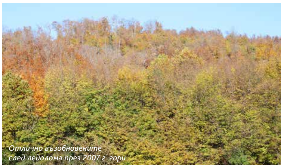
Отлично възобновените след ледолома през 2007 г. гори