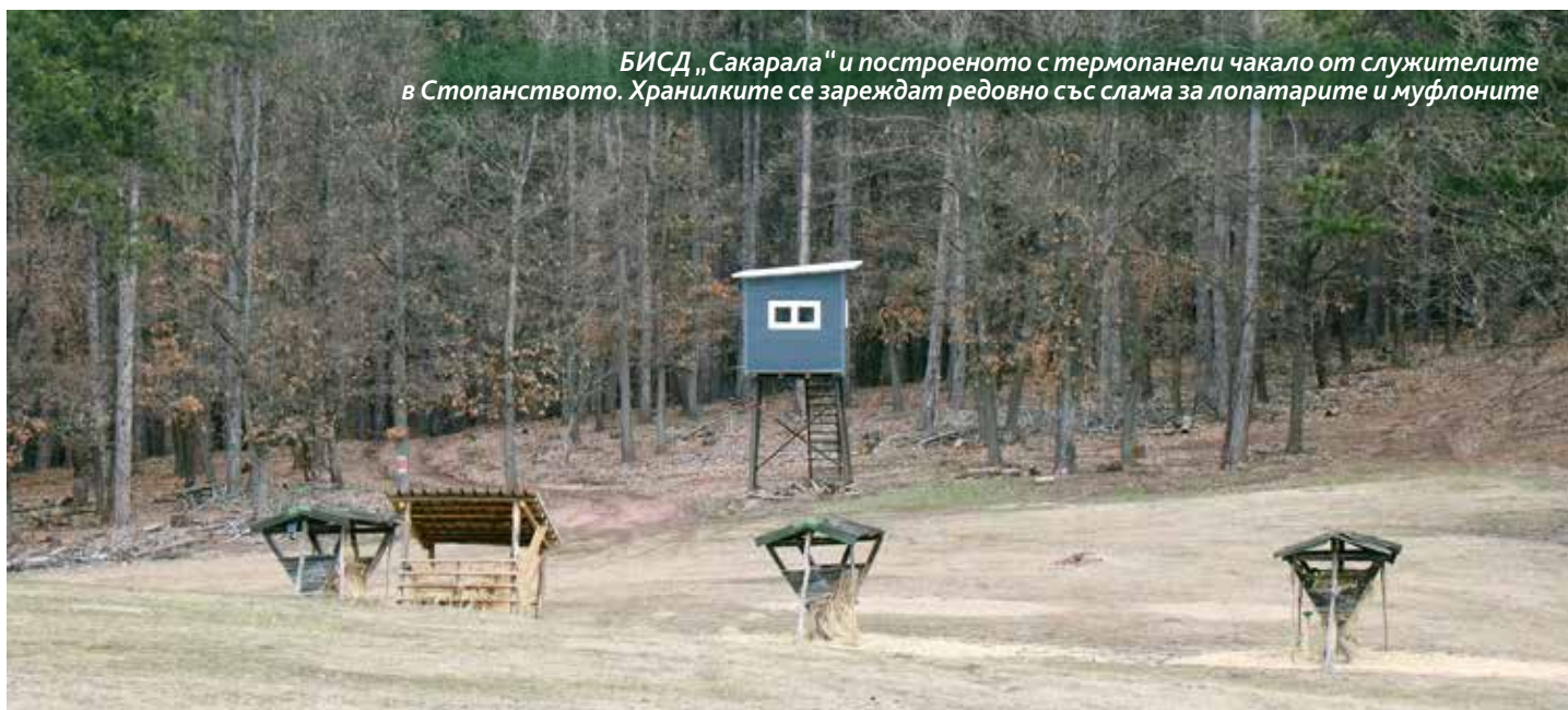
БИСД „Сакарала“ и построеното с термопанели чакало от служителите в Стопанството. Хранилките се зареждат редовно със слама за лопатарите и муфлоните

В подножието на върха ни чакат дивечови ниви с разположени електронни хранилки за благородните елени и дивите свине, зареждани със слама и ронена царевица. Наесен дивечовите ниви се засяват с пшеница, а напролет – с овес, общо са 200 дка, пръснати по територията на Стопанството. В обхвата му има една защитена местност за опазване на характерния ѝ ландшафт – „Арамлиец“. В тази територия е въведена забрана за провеж-