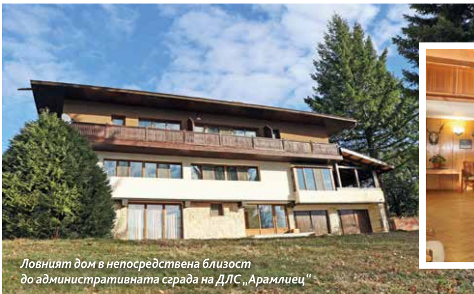
Ловният дом в непосредствена близост до административната сграда на ДЛС „Арамлиец“

Положителната тенденция в прираста на елена лопатар също е