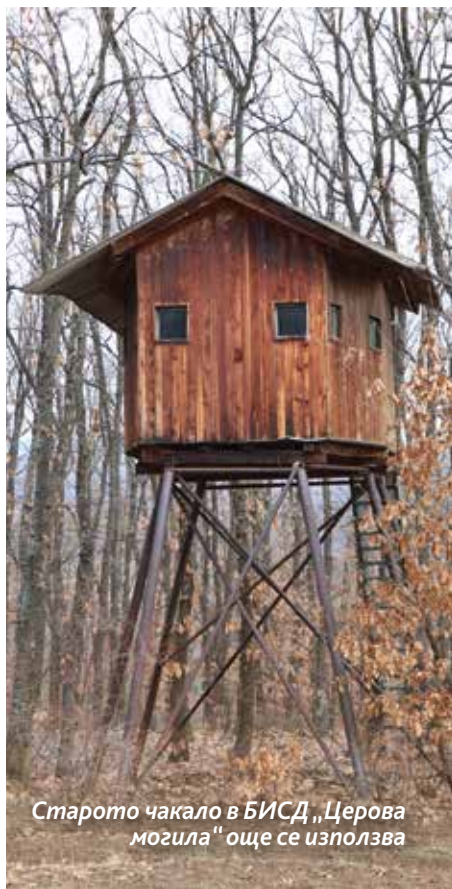
Старото чакало в БИСД „Церова могила“ още се използва

терени те са факт преди началото и след края на вегетационния период и така оказват благоприятно влияние върху нормалното развитие на растителността, важно за дивечката негова храна, от една страна, и върху раждането и отглеждането на приплодите му – от друга. Опасни за дивечката са минималните температури през април, които могат да предизвикат масова смъртност сред приплодите, както и измръзване на младите леторасли и посевите във връзка с осигуряване на хранителната му база.