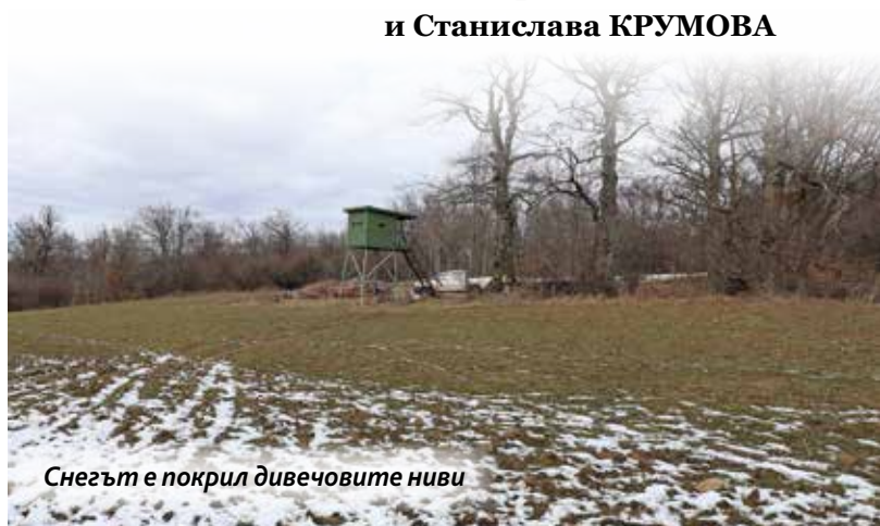
Снегът е покрил дивечовите ниви