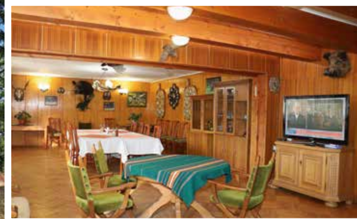
Трапезарията в ловния дом – място за изживяване на паметните моменти от лова