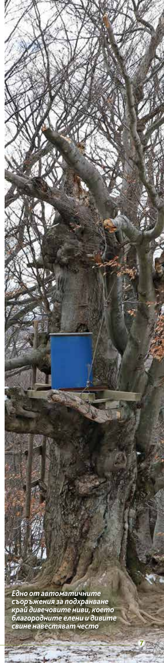
Едно от автоматичните съоръжения за подхранване край дивечовите ниви, което благородните елени и дивите свине навещават често

Проблем за насажденията в ниските части на Стопанството са късните пролетни и ранните есенни мразове, които настъпват след началото и преди края на вегетационния период. В отделни години водят до значителни повреди на горскодървесната растителност – измръзване, мразобойни, мразозтегляния и други. По високите