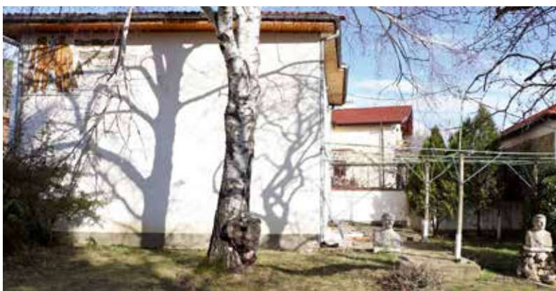
Музеят на залесителното дело в гр. Шипка, открит през 1980 година