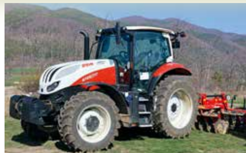
Разсадникът „Ветрен“ на Държавно горско стопанство – Мъглиж, създаден през 1924 година

Огромно удоволствие, повярвайте ни, е да посетиш горски разсадник. А ако той е и един от най-известните в страната, с традиции, с производство на качествен посадъчен материал, с добра материална и техническа база и с хора, които в работата си влагат много любов, какъвто е разсадникът „Ветрен“ на ДГС – Мъглиж, не ти се напуска този „родилен дом“ на гората. Разсадникът е от 208 дка и тази година ще отбележи своята 100-годишнина.