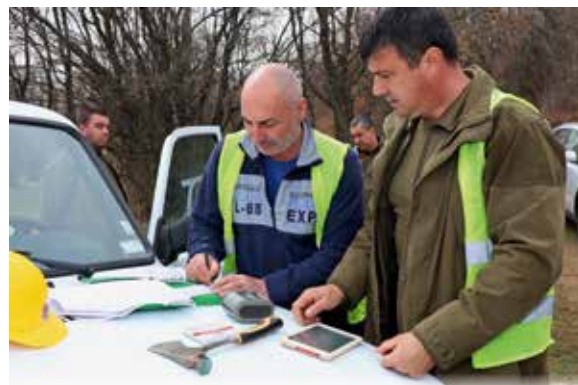
Проверката в сечището завършва с оформянето на документацията

съставяме актове, а да обучим собствениците да работят законно и честно. Но в същото време разработихме и методика за рискови обекти.“