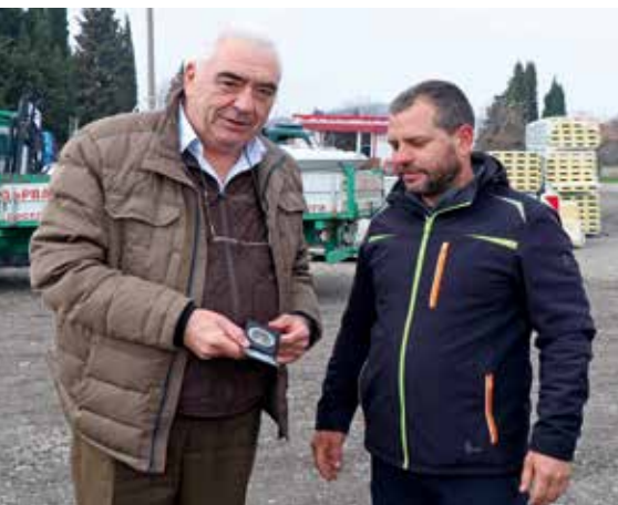
Преди да започне проверка, горските инспектори задължително се легитимират