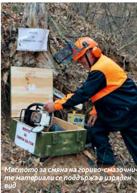
Мястото за смяна на гориво-смазочните материали се поддържа в изряден вид