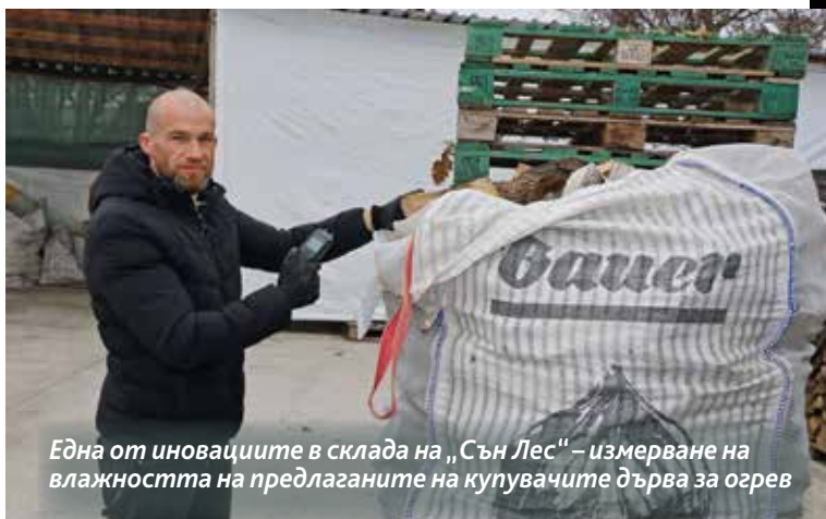
Една от иновациите в склада на „Сън Лес“ – измерване на влажността на предлаганите на купувачите дърва за огрев