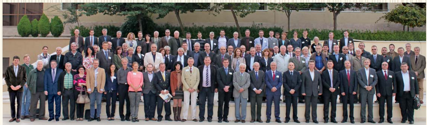
Годишна конференция на СЕЛ, 2014 г., Несебър