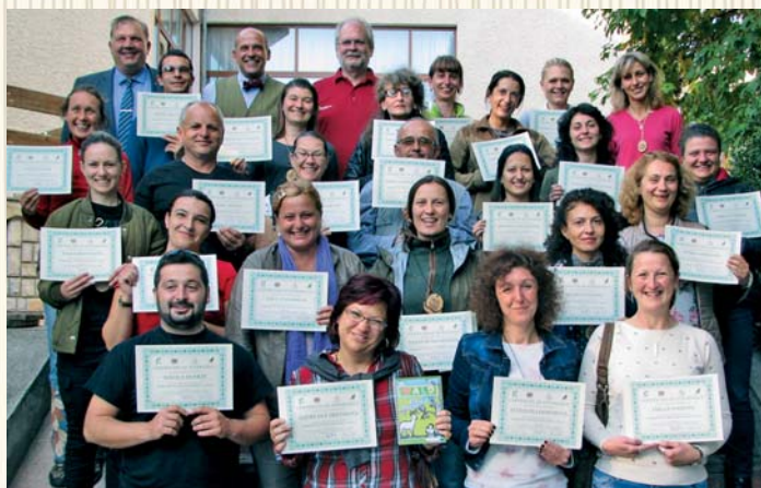
Участници в обучение по дисциплината „Горска педагогика“ - второ ниво, 2017 г., УОГС „Ст. Аврамов“ - м. Юндола