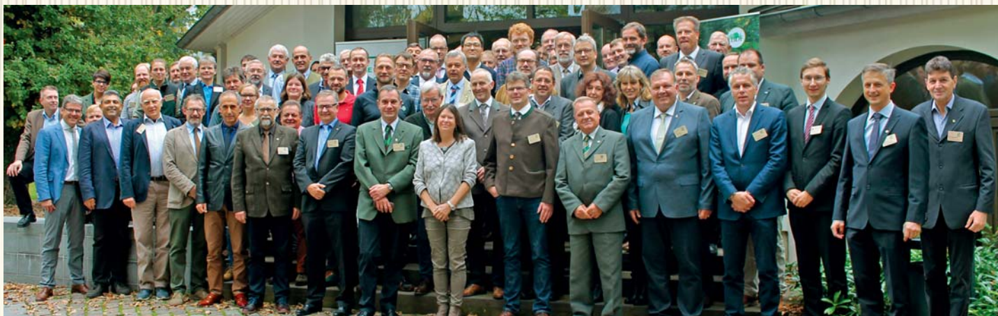
По време на XIX конгрес на СЕЛ в Майнц, Германия, се провежда международен семинар с представители на Европейската асоциация на общините - собственици на гори