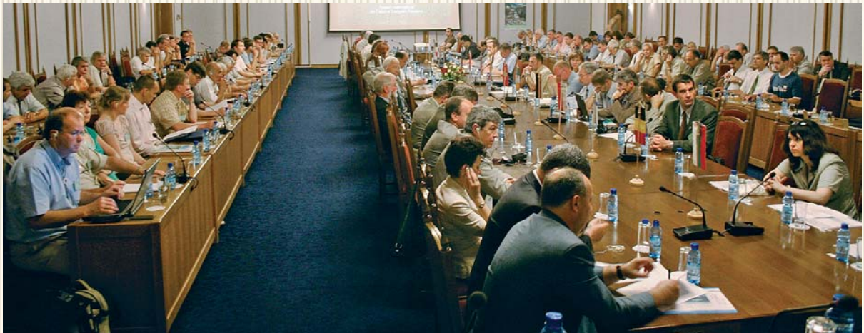
Заседание на конференцията на СЕЛ, 2006 г., резиденция „Бояна“

От 27 юни до 2 юли 2006 г. СЕЛ провежда в България годишната си конференция. Основна тема на изнесените доклади е „Стопанисване на горите с лесо̀в̀д̀ски методи“. На 9-12 октомври 2014 г. в Несебър се провежда за втори път в България среща на СЕЛ с участието на 14 организации от 11 страни, на която се обсъждат и вземат решения по най-важните въпроси от дейността на европейската организация. В рамките на срещата е организиран научно-практически семинар „Устойчиво управление на гори при различни форми на собственост“. Проведени са обсъждания и се вземат решения за дейността на Съюза на европейските лесо̀в̀д̀и. Домакинството на нашата страна е високо оценено. Тези срещи допринасят за утвърждаване на името на България в европейската общност, заслуга за което има цялата лесо̀в̀д̀ска колегия у нас. Като израз на уважение и доверие към СЛБ г-р Анна Петракиева от 2011 г. е избрана за член на Президентството на СЕЛ, първоначално като помощник-секретар, а от 2017 г. за касиер. Инж. Борис Господинов два мандата е член на одиторския екип в Съюза на европейските лесо̀в̀д̀и.