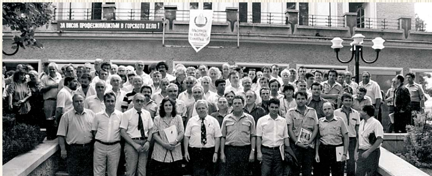
Делегати на Четвъртия конгрес на СЛБ, Велинград 05.07.1996 г.

на правата и професионалните интереси на членовете, подобряване на състоянието на горите, устройство на горското стопанство, борба с ерозията в опустошени планински райони. В онези трудни времена Дружес-