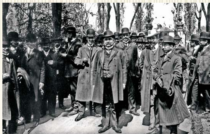
Участници в Учредителния конгрес на лесовъдите през 1909 г. в София

Въпреки пренебрежителното отношение към усилията за сружване на колегията, на 20 април 1909 г. в София се провежда учредителният конгрес, на който се основава Дружеството на българските лесовъдци. То си поставя за цел обединяването на лесовъдите за защита