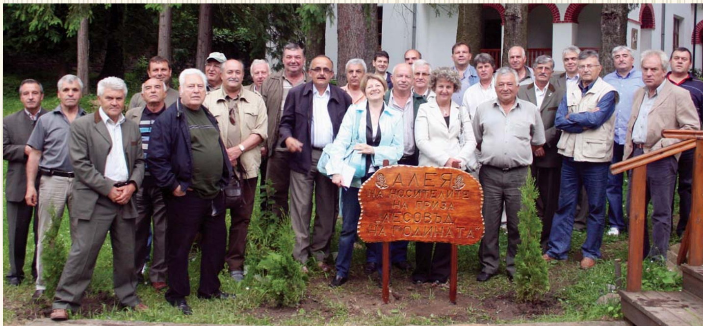
Първа национална среща на носителите на приза „Лесовъд на годината“, 2011 г., УОГС „Петрохан“ - с. Бързия

На 10-11 юни 2011 г. Съюзът на лесовъдите в България съвместно с Изпълнителната агенция по горите провеждат Първа национална среща на наградените с приза „Лесовъд на годината“ и техните подгласници. Срещата се провежда в УОГС „Петрохан“ - с. Бързия. Тя е посветена на Международната година на горите и навършването на 15 години от първата номинация с приза. Срещата се ознаменува със създаването на Алея на носителите на отличието „Лесовъд на годината“.