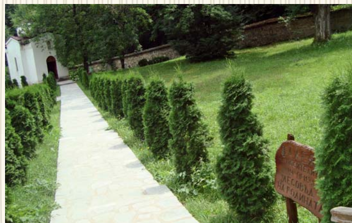
Алея на лесовъда в Клисурския манастир

През 2012 г. по инициатива на журналистите от списание „Гора“ - издание на Изпълнителната агенция по горите, и с подкрепата на издателя и Съюза на лесовъдите в България започва издирването и почистването на паметниците, изграждани у нас от началото на XX в. в чест на заслужили лесовъди и важни събития от горската история. Успоредно с това СЛБ инициира изграждането и откриването на нови паметни знаци. Оттогава Съюзът на лесовъдите в България през годините и в дните на отбелязване на Седмицата на гората организира почистването и обновяването на чешми, мемориални плочи и паметници на бележити лесовъди, служили на каузата за запазване на българската гора. Изградени са много нови паметни знаци с участието на колегията по места.