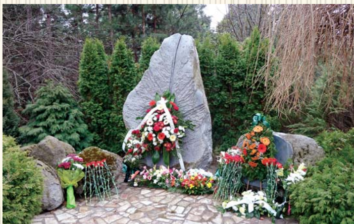
Мемориалът на лесовъдите, Лесотехническият университет