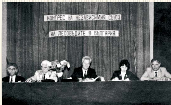
Президиум на Първия учредителен конгрес на Независимия съюз на лесовъдите в България - 12.10.1909 г., София

на правата и професионалните интереси на членовете, подобряване на състоянието на горите, устройство на горското стопанство, борба с ерозията в опустошени планински райони. В онези трудни времена Дружес-