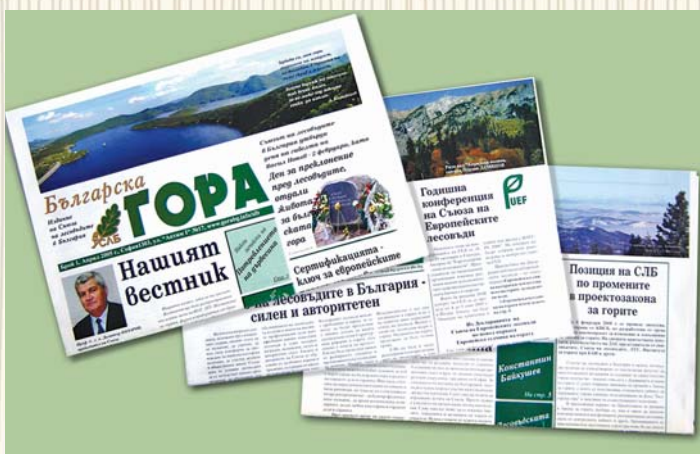
На 01.04.2005 г. излиза първият брой на в. „Българска гора“ - издание на СЛБ. С него се възстановява традицията съюзната организация да има своя печатен орган

На 5 януари 2005 г. Председателството на СЛБ в съответствие с решенията на общото събрание от 16 септември 2004 г. решава да започне издаването на вестник „Българска гора“ - печатен орган на Съюза на лесовъдите в България. През април същата година се отпечатва първият брой на в. „Българска гора“. Целта на изданието е да обединява българските лесовъди в силна организация и да поставя много от въпросите, свързани със стопанисването на нашето национално богатство - гората. С издаването на вестника се открива възможността лесовъдската колегия да отразява общата позиция по всички животнорепнящи въпроси, които засягат съюзния живот и горското дело в нашата страна.