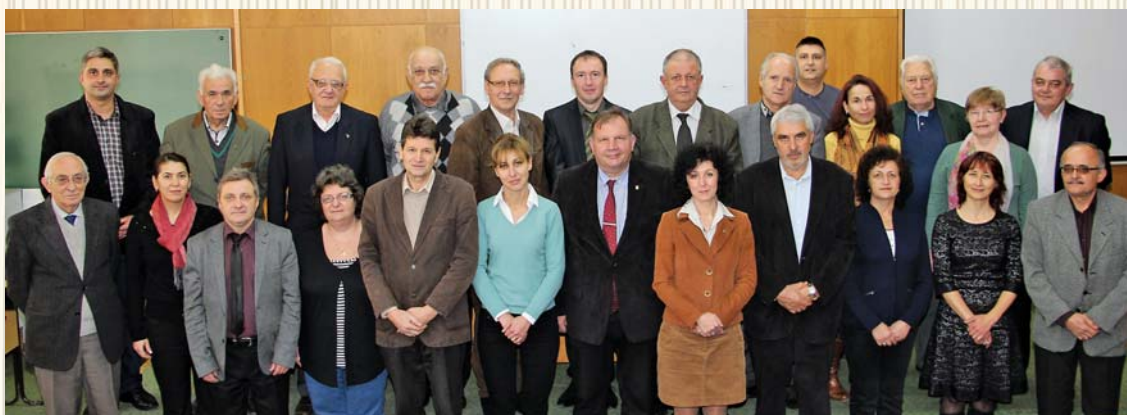
Заседание на Управителния съвет на СЛБ, 09.12.2016 г., София