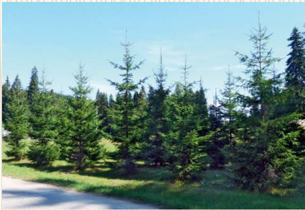
Европейска гора, създадена през 2006 г. в м. Старина, УОГС - Юндола