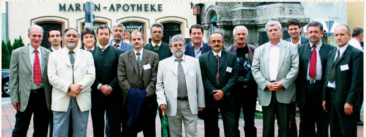
Българската делегация на XVI конгрес на СЕЛ, 14-16.06., 2005 г., Германия

През 1996 г. Съюзът на лесовъдите в България за първи път участва в работата на XIV конгрес на Съюза на европейските лесовъди, проведен в Полша. Съюзът на европейските лесовъди (СЕЛ) е основан през 1972 г. като Международен клуб на лесовъди, който прераства в европейска