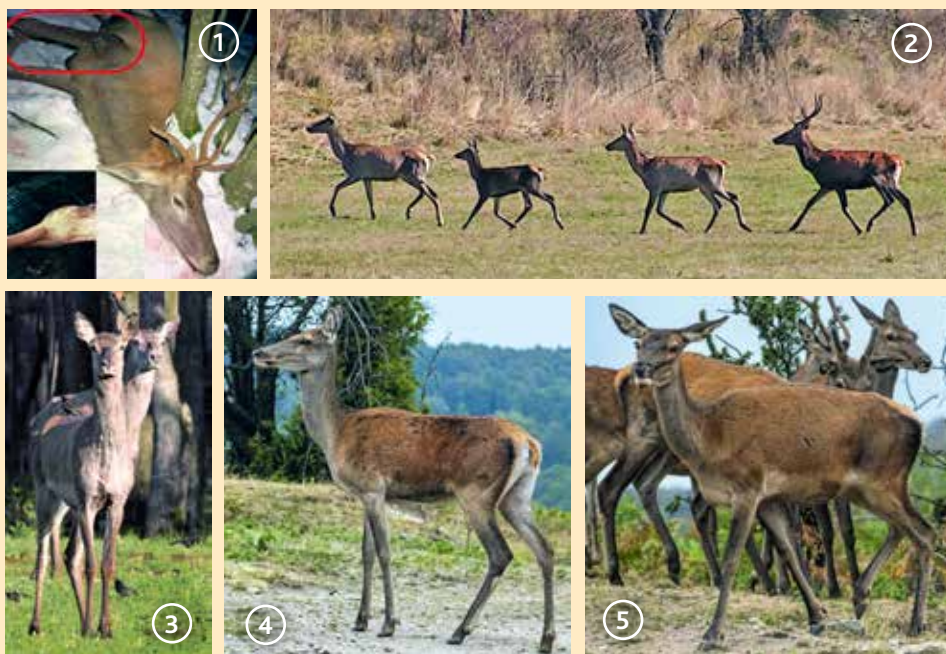
Сн. 1. Благороден елен с нараняване, оказало трайно влияние върху развитието на рогата Сн. 2. Зряла кошута с приплод, нераждала кошута (миналогодишна)

Необходимо е да се отбележи, че трофейните качества на благородния елен варират в различните части на страната, като тази разлика е най-осезаема в зависимост от надморската височина. Едрината на тялото също се различава в отделните популации, което налага наличието на добри познания у ловеца по отношение на средното ниво за всяка възрастова група на вида в района, в който се извършва селекция.