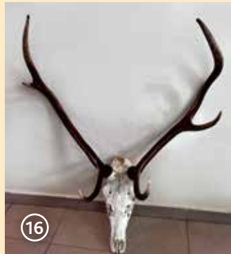
Сн. 16. Трети рога със слаби средни шипове, без корона