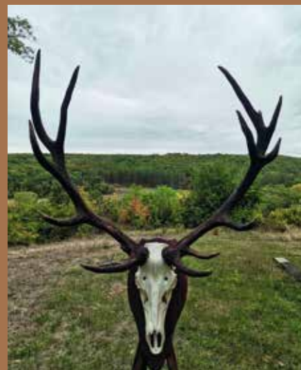
Трофей на 12-годишен елен