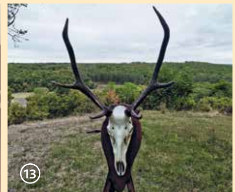
Сн. 13. Втори рога на перспективен елен, неподлежащ на отстрел (рогата са дебели, с добри дължини)

и ушите (при възрастните те лягат все по-назад). При зрелите кошути отстрелът следва да бъде насочен към яловите и слабите, престарелите и такива, които водят изостанали в развитието си телета.