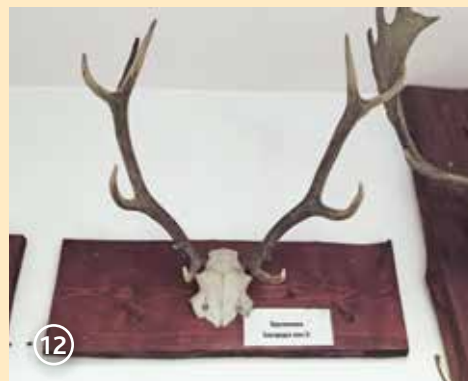
Сн. 12. Втори рога с добри заложби – еленът не подлежи на отстрел

Младите нераждали кошути по големина достигат почти размерите на зрелите, като тялото им все още има по-стройна структура (сн. 4 и 5). Основните белези за различаване на двете възрастови групи са коремът (при зрелите той провисва все повече с течение на времето вследствие на ражданията), дебелината на врата (при младите животни той е по-тънък)