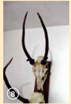
Сн. 8. Шилар с добри дебелини на рогата, но с малък размах