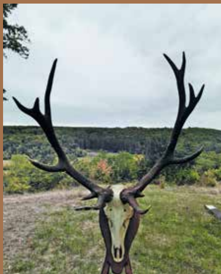
Трофей на 15-годишен елен