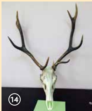
Сн. 14. Трети рога – несиметрични