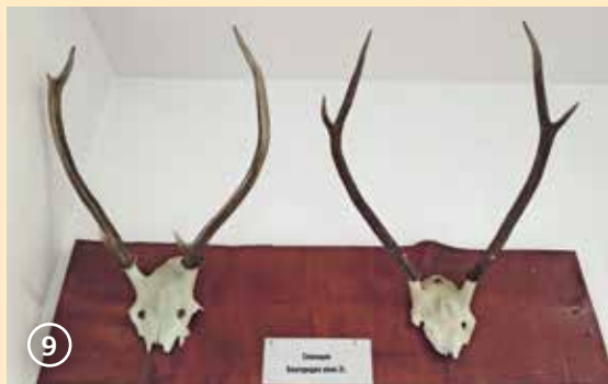
Сн. 9. Втори рога – неперспективни