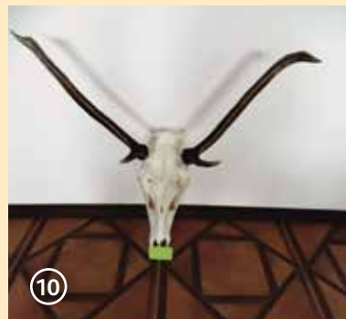
Сн. 10. Втори рога без средни шипове, с прекалено голям размах – подлежи на отстрел