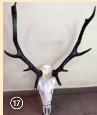
Сн. 17. Четвърти рога със слаби трофейни заложби

мата мъжките в определени случаи укрепват повече, имат мръснобял корем поради придобиването на кичурче от косми около половия орган. При някои индивиди през януари започват да си личат пънчетата на рогата, което съществено улеснява разпознаването.