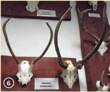
Сн. 6. Перспективни шилари, неподлежащи на отстрел