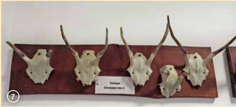
Сн. 7. Шилари, подлежащи на отстрел