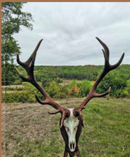
Трофей на 9-годишен елен