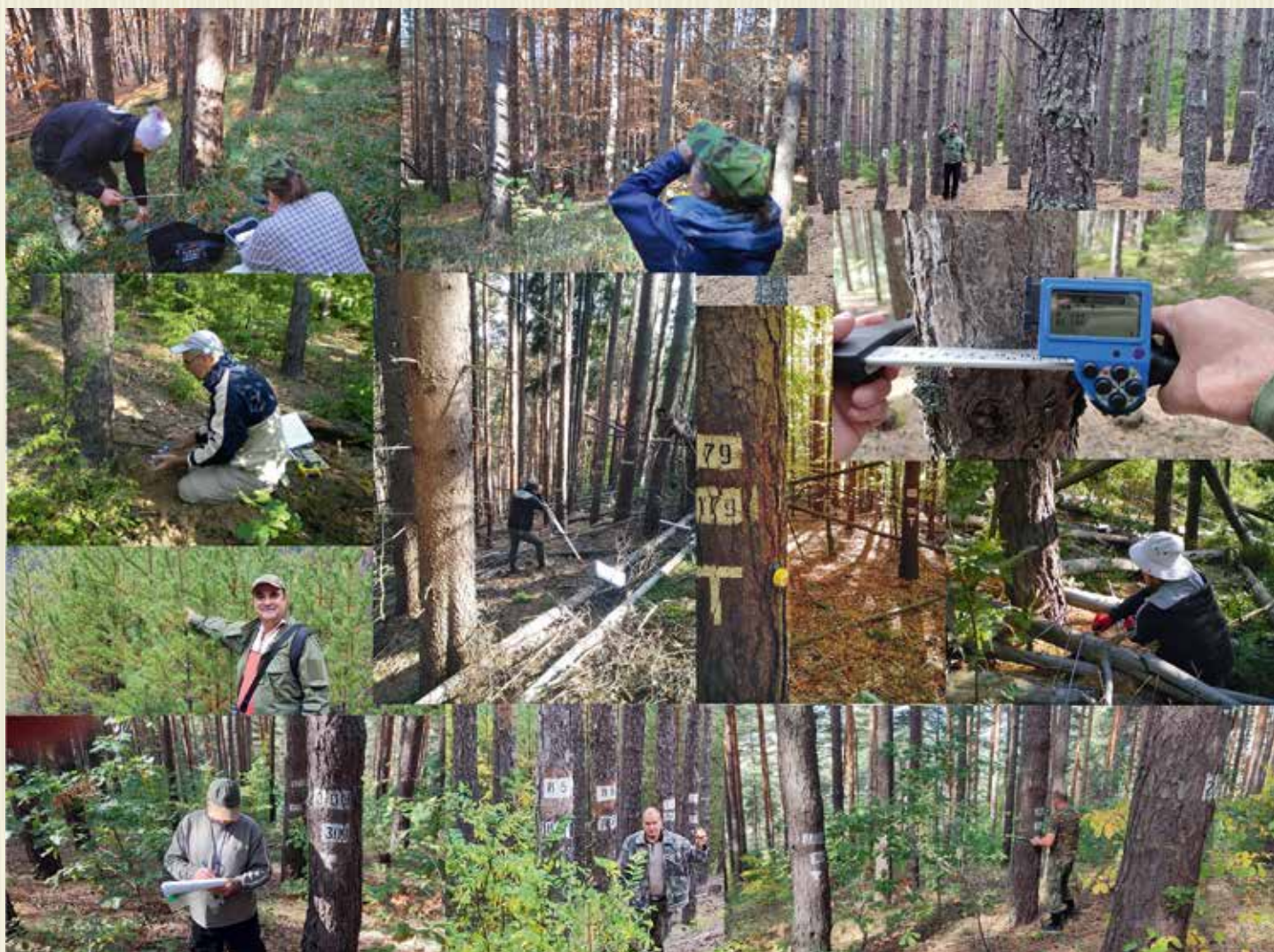
Моменти от теренните изследвания в постоянни пробни площи в белоборови култури през 2022 г.

на насажденията и влиянието на стопанските дейности върху тях от 70-те години на миналия век насам у нас се залагат постоянни пробни площи в различни по състав и възраст горски насаждения. Те се инвентаризират през 10 – 15-годишни интервали и данните от измерванията се съхраняват в приложенията към предходните и настоящите лесоустройствени планове. Събираната информация обхваща данни за месторастенето и за насаждението, като всяка опитна площ е залагана с 1 до 3 клетки, най-често 2 – една контролна и една експериментална. Изследват се растежът, производителността и прирастът на насажденията, а в експерименталните клетки обикновено се извеждат сечи с различна интензивност и повтораемост и в съпоставка с контролните клетки се анализира ефектът от приложеното стопанисване. Залагането на постоянни пробни площи в белоборовите култури у нас датира от 1967 г., а най-новите от тях са заложени през 2012 – 2013 година. Понастоящем има данни от измервания в 38 постоян-