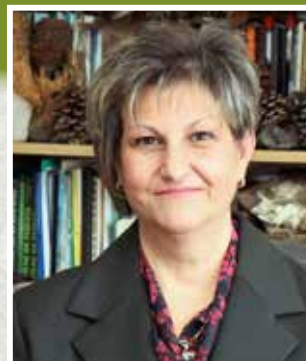
Екип на списание „Гора“

Целта на дейностите, изпълнявани от РДГ съвместно с РС ПБЗН, е да се поддържа постоянна готовност на собствениците/стопанисващите горски територии за своевременна реакция, да се набележат мерки за подготовка на наличната техника, да се обучат гасаческите групи и да се подобри организацията за реакция при пожари. Без работата на всички, участвали в гасенето на горски пожари – служители и доброволци, много от пожарите нямаше да останат малки запалвания.