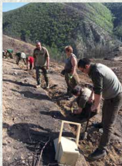
▲ Служителите на РДГ – Благоевград, извършват пролетно залесяване на пороя „Бабин трап“ над с. Крунник. Целта е укрепване на терена и предотвратяване на свлачищните процеси, които при всеки интензивен валеж затварят главен път Е79. В тежките условия на голям наклон и почти пълна липса на почвен слой лесовъдите изграждат плетове и тераси

◀ Върху териториите, освободени след големия пожар в Кресна през 2016 г., е създадена пробна култура от черен бор с различен произход, с висок процент на прихващане. Основното предизвикателство остава неконтролираната паша въпреки загражденията