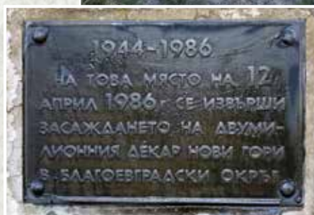
Паметната плоча над града, поставена при залесяването на двумилионния декар гора

от 24.10.1934 г.). Тя въвежда строги правила за ползването на дървесина и пресича практиките на безразборна експлоатация. С него държавата за първи път поема ангажимент не само да добива, но и системно да възобновява и опазва горските масиви в Югозапада.