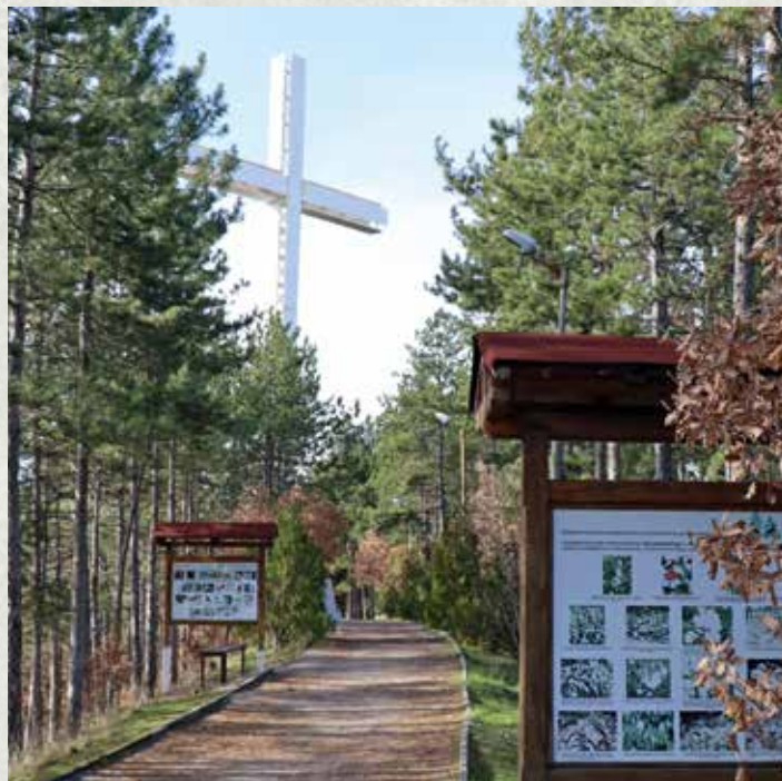
Кръстът, издигащ се над Благоевград, е един от най-разпознаваемите символи на града

Всякакви кампанийни и ускорени действия в нашата професия са много опасни, а залитането в една или друга посока води до лоши резултати. Основен принцип в лесовъдството е равномерността и устойчивостта на ползването и ние като дирекция се опитваме да го гарантираме.