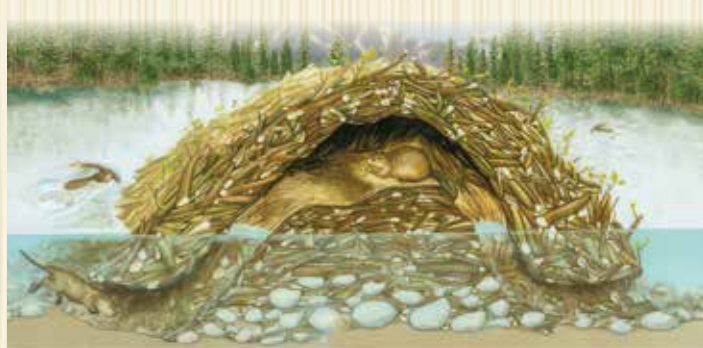
Жилище на бобър

шите фотокапани дори улови белка, която охотно и безпроблемно изяде плодовете, оставени за Бобчо.